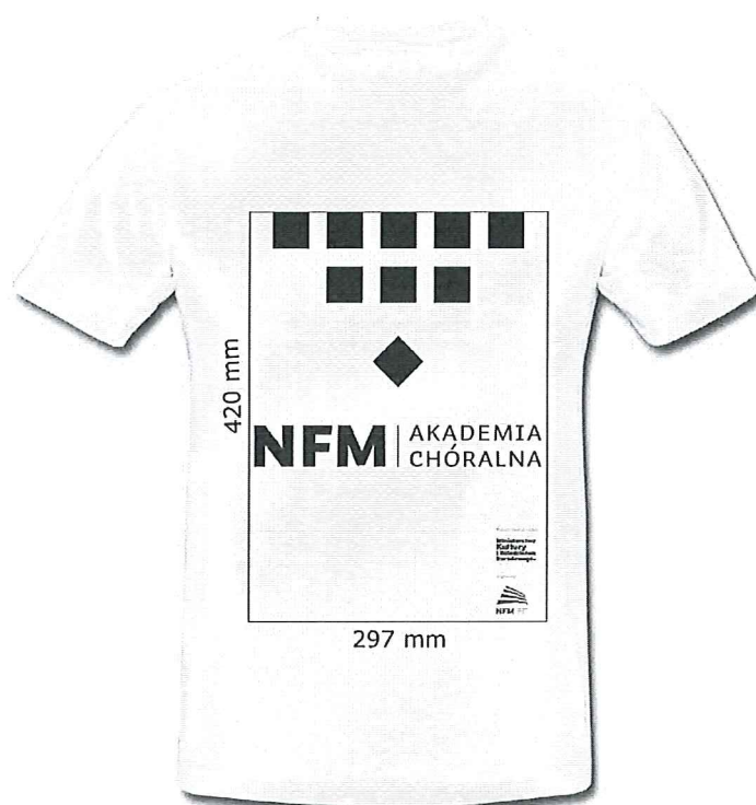
koszulka z wymiarami