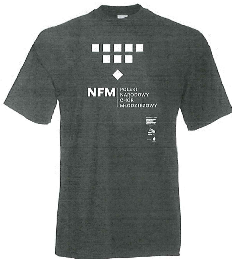
Koszulka PNChM - przykład