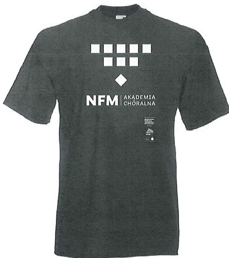
Koszulka Ach - przykład